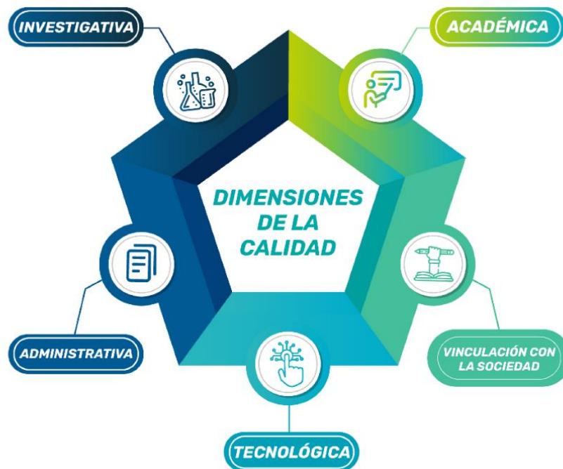
Ilustración 6 - Dimensiones de la Calidad.

En la sociedad del conocimiento, la calidad educativa requiere un ecosistema tecnopedagógico digital robusto, accesible y seguro. Esta dimensión se articula directamente con el Modelo Educativo, entendido como el conjunto integrado de infraestructuras, plataformas, herramientas digitales, metodologías y prácticas pedagógicas que sostienen y potencian las funciones sustantivas de la vida universitaria. En este sentido, analiza la disponibilidad y el uso efectivo de los entornos virtuales de aprendizaje (EVA), la capacitación del personal académico en competencias digitales, el uso de plataformas de evaluación en línea, la ciberseguridad institucional y el soporte técnico para estudiantes y docentes. Asimismo, contempla la utilización de la analítica de datos para el seguimiento de la trayectoria académica y la toma de decisiones basada en evidencia. Según García (2023), la tecnología debe ser un medio para la innovación educativa y no un fin en sí misma, de manera que permita experiencias de aprendizaje personalizadas, colaborativas, inclusivas y accesibles. En la UEA, esta dimensión adquiere especial relevancia por la dispersión geográfica de sus estudiantes, lo cual demanda soluciones que articulen las modalidades presenciales, híbridas, en línea y dual, con el propósito de garantizar cobertura con calidad.