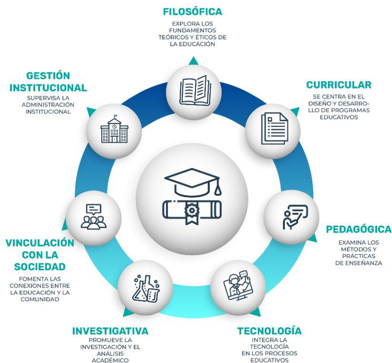
Ilustración 2 - Interrelación de las Dimensiones del Modelo Educativo

En conjunto, estas dimensiones conforman un sistema coherente y sostenible, alineado con la misión institucional de la Universidad Estatal Amazónica y con las prioridades definidas en su marco estatutario, basadas en los principios de autonomía responsable, calidad, inclusión e interculturalidad. La interconexión de las dimensiones asegura una formación integral, pertinente y comprometida con el desarrollo sostenible de la Amazonía y del país.