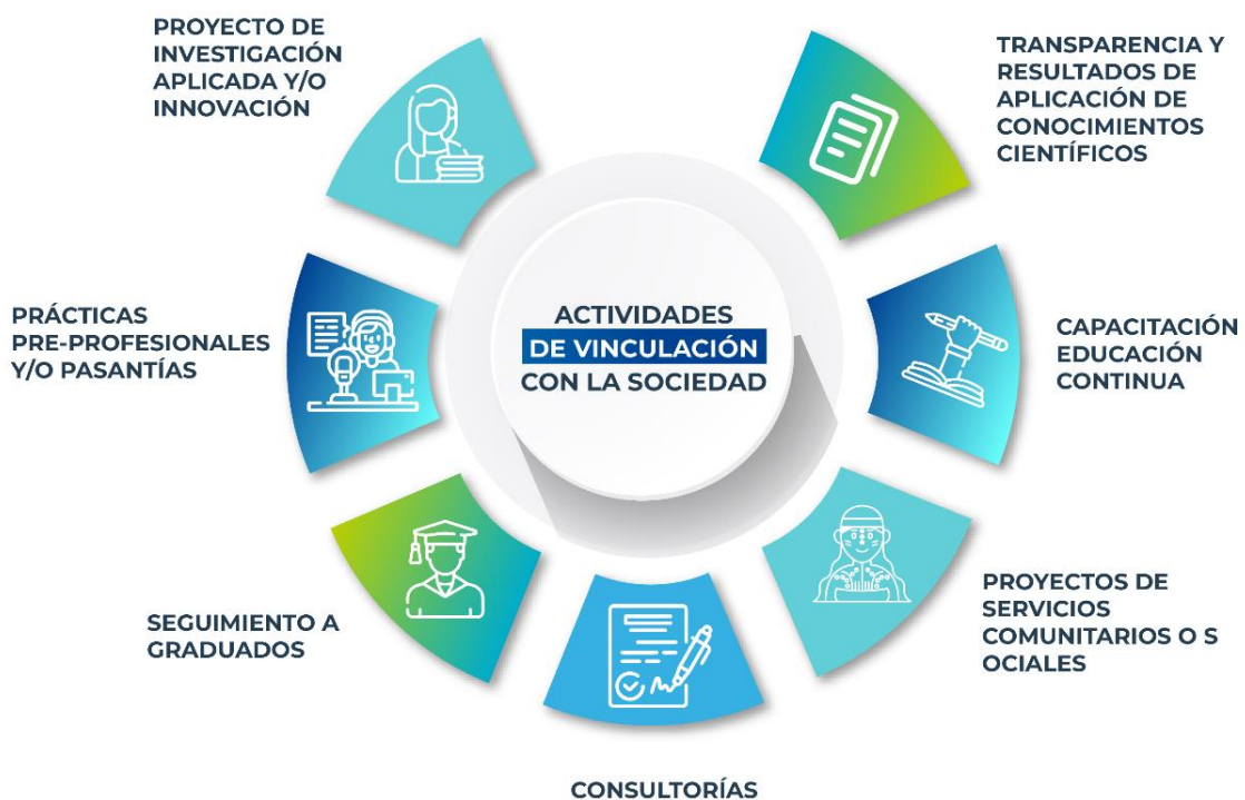
Ilustración 4 - Actividades de Vinculación con la sociedad de la UEA

El siguiente gráfico resume de manera sintética las principales actividades que estructuran esta función sustantiva, evidenciando el compromiso institucional con la transformación social y la generación de soluciones para los desafíos de la región amazónica y del país.