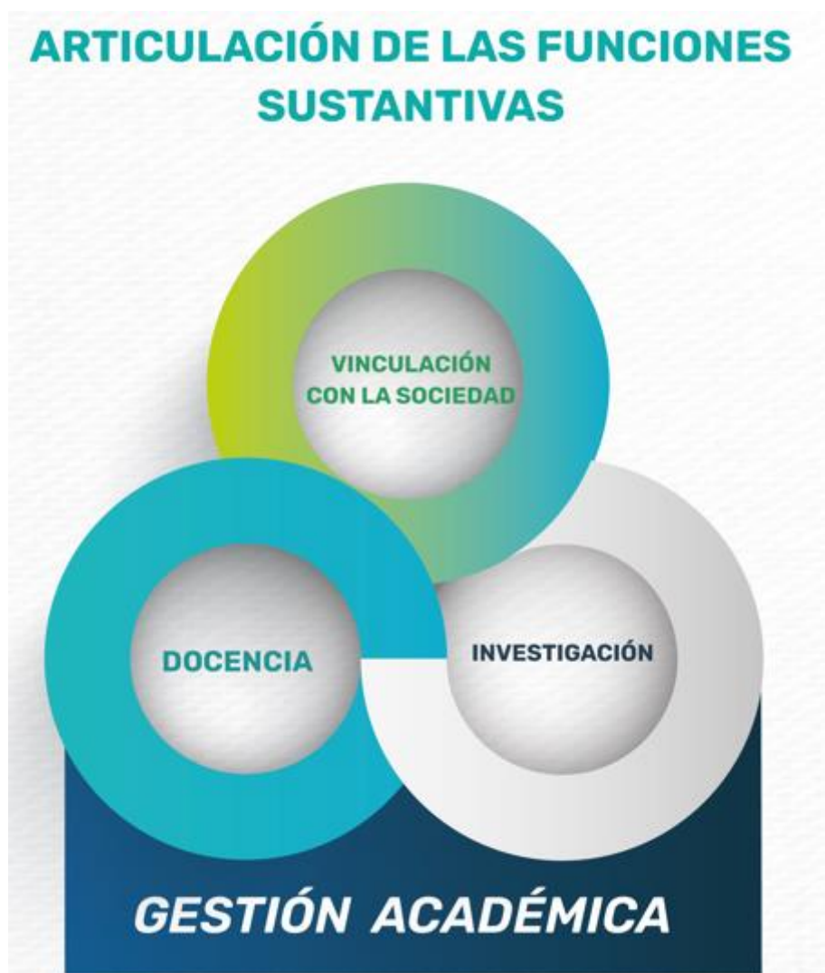
Ilustración 5 - Articulación de las funciones sustantivas.

La fortaleza institucional de la Universidad Estatal Amazónica reside en la interacción sinérgica de las funciones de docencia, investigación y vinculación con la sociedad. Cuando estas funciones se articulan de manera efectiva, el estudiante se convierte en protagonista activo de su proceso formativo; la investigación adquiere sentido social y territorial; y la vinculación se consolida como un espacio de aprendizaje, validación y diálogo de saberes. Esta integración promueve la formación de profesionales críticos, éticos y comprometidos con el desarrollo sostenible de la Amazonía, en coherencia con la misión institucional y los principios del Sistema de Educación Superior ecuatoriano. Esta integración sinérgica se sostiene en una gestión académica coherente.