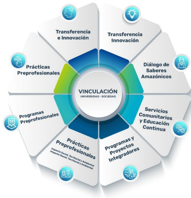
Ilustración 3 - Procesos y dinámicas de Vinculación Universidad–Sociedad

En este marco, el objetivo institucional se orienta a ejecutar planes, programas y actividades que generen soluciones sostenibles a los problemas ambientales, sociales y tecnológicos de la región amazónica, contribuyendo al desarrollo equilibrado del territorio. Estas acciones se articulan con los procesos de enseñanza-aprendizaje y con la investigación, asegurando que las intervenciones respondan a necesidades reales y a prioridades definidas junto a los