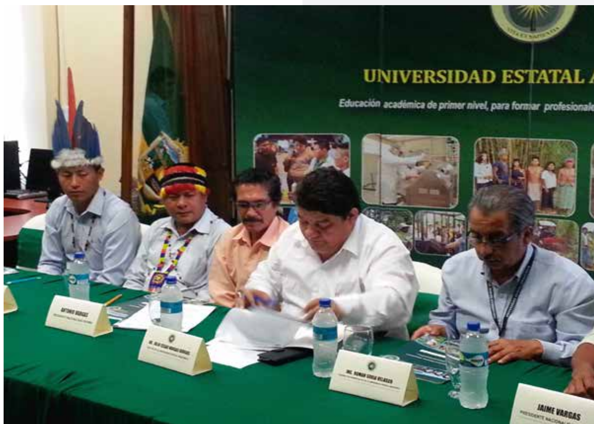
Autoridades de la Universidad Estatal Amazónica y de las Nacionalidades firmando convenio. UEA, Puyo, Pastaza.

runa wankurishkakuna shuyahka shina, mutsurishka shima, Ecuador sumak ruraykuna, shinallata kikin hatun llaktakuna, yuyaykuna, runa kawsaykuna shinallata sumak kawsay wiñarimamanta rikushpa hapakun. Chaypak, sumak hatun yachana wasikuna paykuna yachachinakunapi, taripanakunapi, kawsakunawan llutarina kan, yachay mutsurishkakuna shinallata, llakta, suyu, ecuador mamallaktap wiñarinka, ima sami yachay tukunata mushukyachishpa, yachay paktaykunata imashina llankana, llaktakuna, Constitución del Ecuador 2008, versión digital, 2014). rimashka shina hanami tukun.