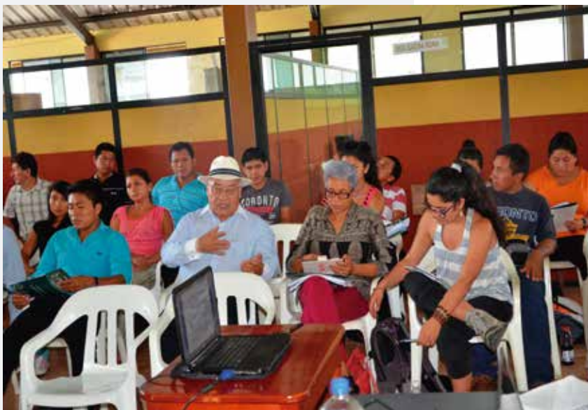
Reunión Universidad Estatal Amazónica y las Nacionalidades en Loreto, Orellana, 2014.

En segundo lugar, está el reto del cambio o la transformación, no solo en el terreno de las nacionalidades que vienen transformándose en las últimas décadas por fuerzas del mercado, por los programas del estado,