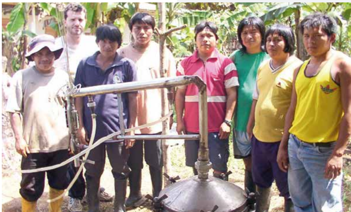
Formación de promotores Comunitarios, Morona Santiago.

Tapuranami kanchik RAE kullki pushayman chayanata maykan tiyaktikunata astawan Yanapay kushkata