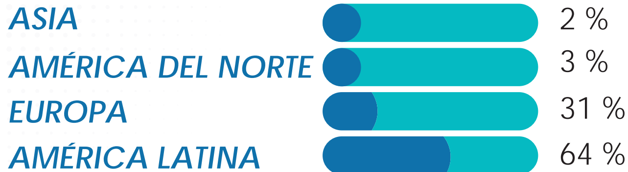
Figura. 1: Detalle de Convenios Internacionales.

En el año 2020, la universidad sostuvo un total de 55 convenios interinstitucionales en ejecución, de ellos, la mayor parte fueron convenios marco. Además, se ejecutó el convenio con REIMA, se firmó el convenio marco con GIZ y se ratificó el convenio para cinco años con CATEDES.